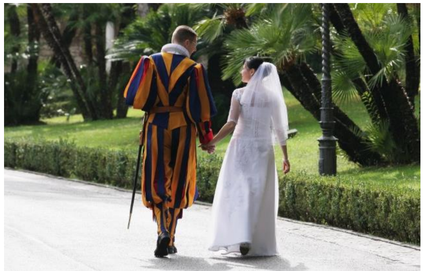
Foto: Ein junges Gardisten-Ehepaar am Anfang des gemeinsamen Lebenswegs.

Diese Mitteilung erfüllte das ganze Korps mit grosser Freude, denn sie eröffnet der Schweizergarde neue Perspektiven für die Zukunft. Zuvor musste ein Gardist für den Schritt in den Ehestand mindestens den Rang eines Korporals bekleiden. Eine hohe Hürde, welche viel Geduld erforderte – und nicht selten waren junge Männer gezwungen, schweren Herzens zwischen Ehe und Garde zu entscheiden.