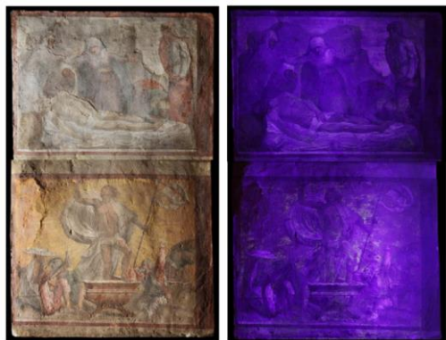
Foto: Zwei Tafelbilder mit Streiflicht und in UV.

Im Campo Santo Teutonico, unmittelbar südlich der Peterskirche, liegt die Kirche Santa Maria della Pietà mit der sog. Schweizerkapelle. Es handelt sich dabei um die erste Kapelle der Schweizergarde, welche zeitweise für die Grablegung deren Kommandanten und Offiziere genutzt wurde. Die Wände der Kapelle wurden 1517-1527 mit wertvollen Fresken überzogen, welche jedoch einer dringenden Sanierung bedürfen. Nachdem die Stiftung für die Päpstliche Schweizergarde im Mai 2015 die Sanierung der Schweizerkapelle als unterstützungswürdiges Projekt genehmigte, ist nun die Finanzierung der ersten Phase, welche die Abnahme der Fresken und deren Wiederherstellung und Konservierung umfasst, zur Hälfte sichergestellt.